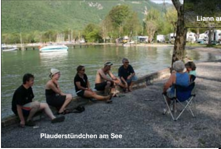
Plauderstündchen am See