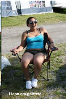
Liann am gniessé